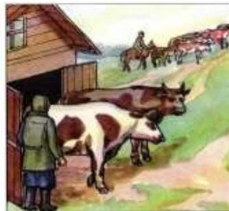
Перегнать скот на возвышенные места