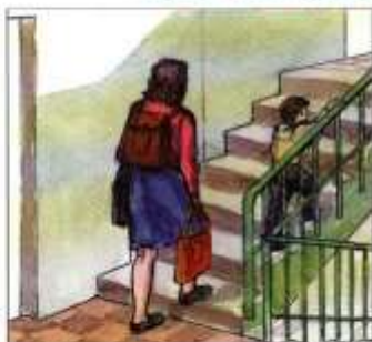
Перенести на верхние этажи продовольствие, ценные вещи, одежду, обувь