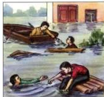
Оказывать срочную помощь людям, почувствовшим в воде