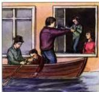
В первую очередь из зоны затопления выводить детей