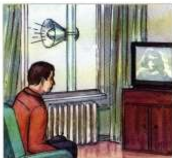
Постоянно слушать информацию об обстановке и порядке действий