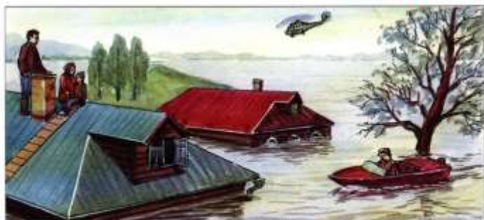
Спасти людей, где бы они ни оказались, используя для этого любые средства